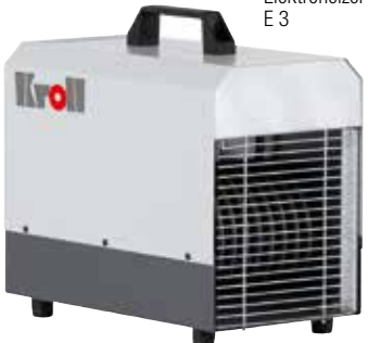
Elektroheizer E 3