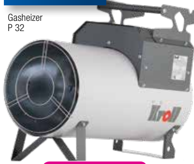
Gasheizer P 32